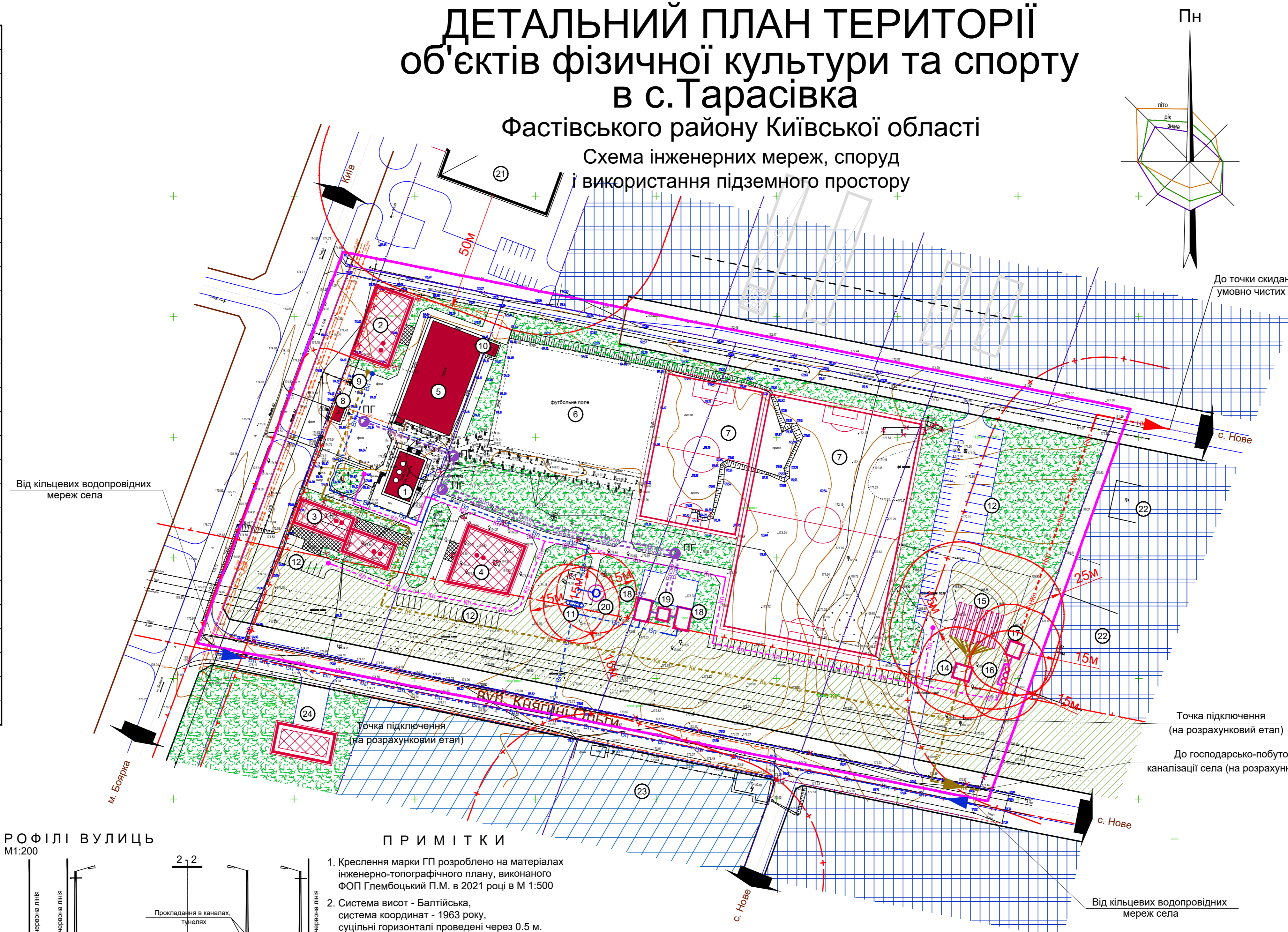
Схема інженерних мереж, споруд і використання підземного простору