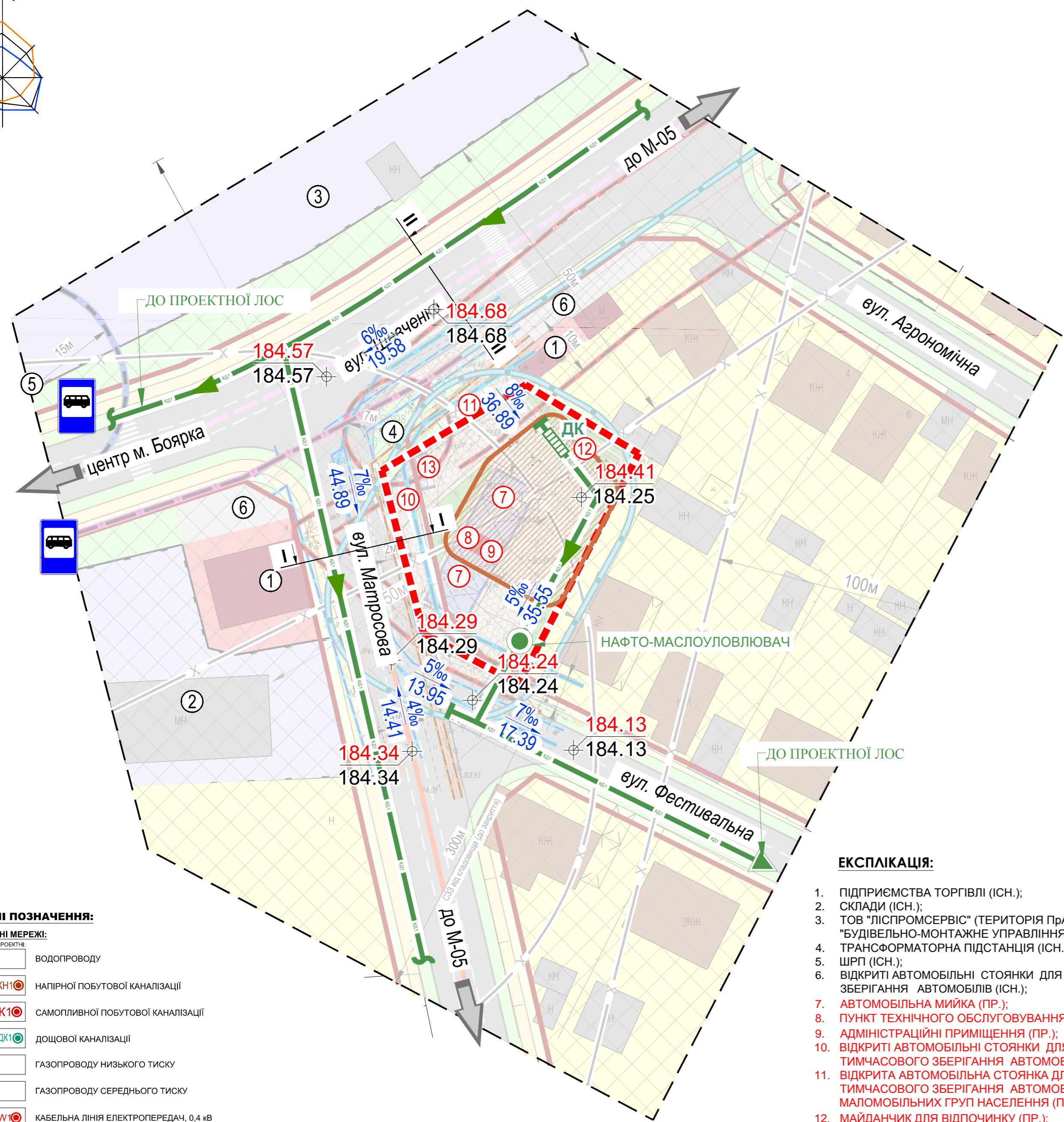
СХЕМА ІНЖЕНЕРНОЇ ПІДГОТОВКИ ТЕРИТОРІЇ ТА ВЕРТИКАЛЬНОГО ПЛАНУВАННЯ М 1:500