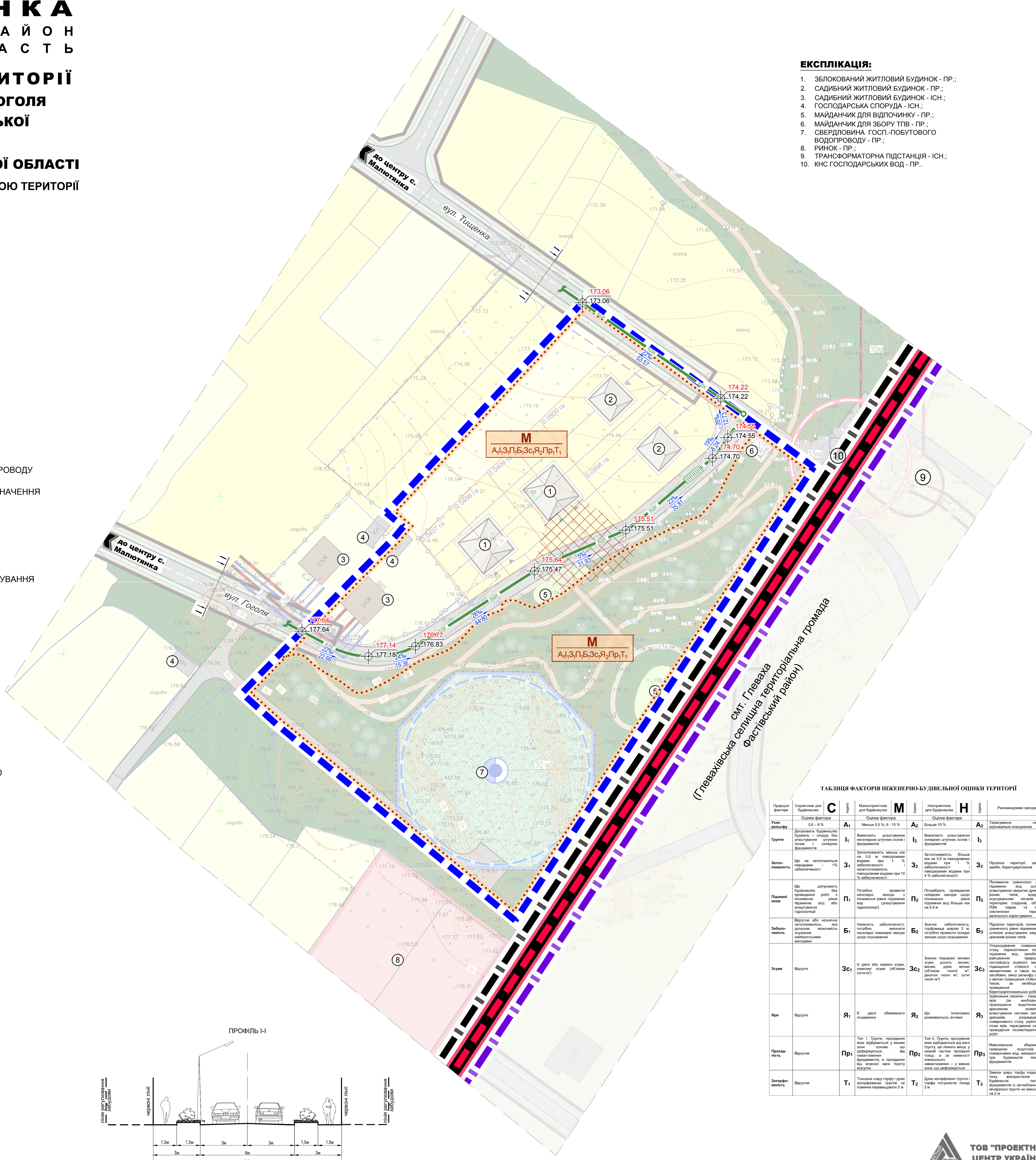
ТАБЛИЦЯ ФАКТОРІВ ІНЖЕНЕРНО-БУДІВЕЛЬНОЇ ОЦІНКИ ТЕРИТОРІЇ