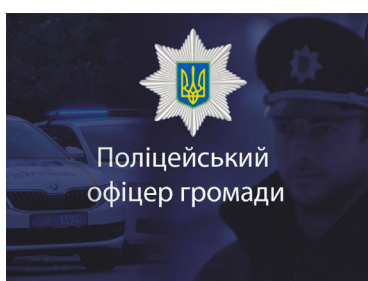
Поліцейський офіцер громади

Головне завдання поліцейського офіцера громади – орієнтуватися на потреби місцевого населення, підтримувати постійний контакт з мешканцями Боярської міської територіальної громади, щоденно забезпечувати порядок на своїй території, своєчасно реагувати на проблеми громади та запобігати вчиненню правопорушень, планувати спільну роботу та разом працювати над тим, щоб громада вдосконалювалася та ставала безпечнішою.