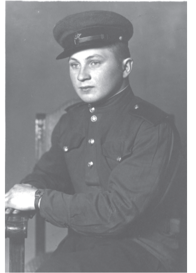
В. Кулаковський. Німеччина. 1946 р.

до Лишнянської середньої школи. У 1958 році призначений директором Лишнянської середньої школи. Цю посаду обіймав 10 років.